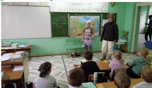
В.И.Белов "Малька провинилась"