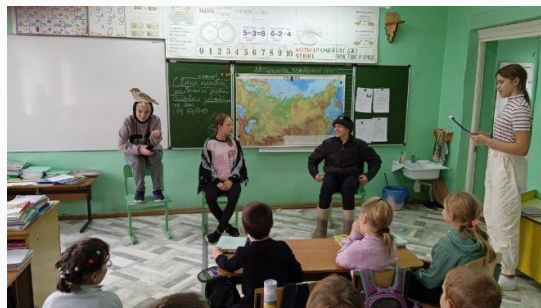
"Как ворона воробья обидела" из "Катюшин дождик" В.И.Белова Спектакль «Теремок» для д/с

28 ноября участники школьного театра "Затейники" (обучающиеся 1 класса) показали для детей детского сада спектакль "Теремок". После спектакля дети подарили свои маски-ободки ребятам дошкольной группы. Все остались довольны и зрители и артисты.